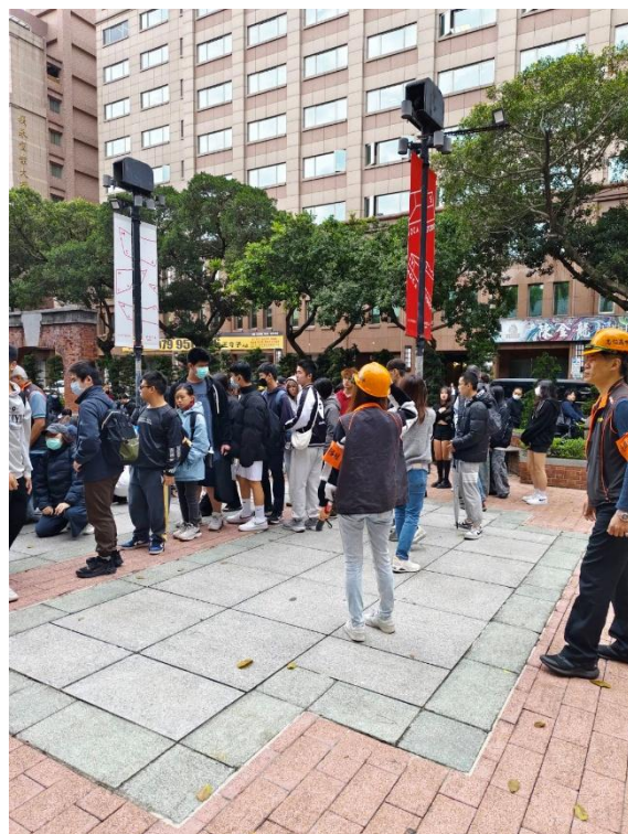
疏散集合地清點人數