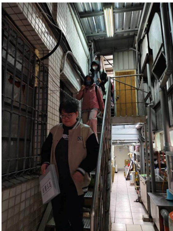
各班實施疏散演練