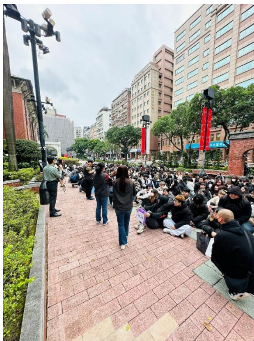
疏散集合地清點人數