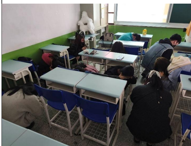
各班實施疏散演練